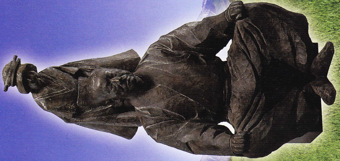
「葉山」(2007年 第39回 日展) 竹園彫刻文庫蔵